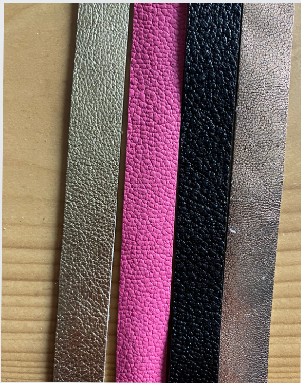
DIVERS CUIRS Métallisés ou Grainés

Bien sûr, l'esthétique et les goûts influent sur votre choix, mais il faut aussi penser à l'usage que vous ferez de votre accessoire, afin de choisir le cuir adéquat. Ainsi vous garderez votre accessoire le plus longtemps possible.